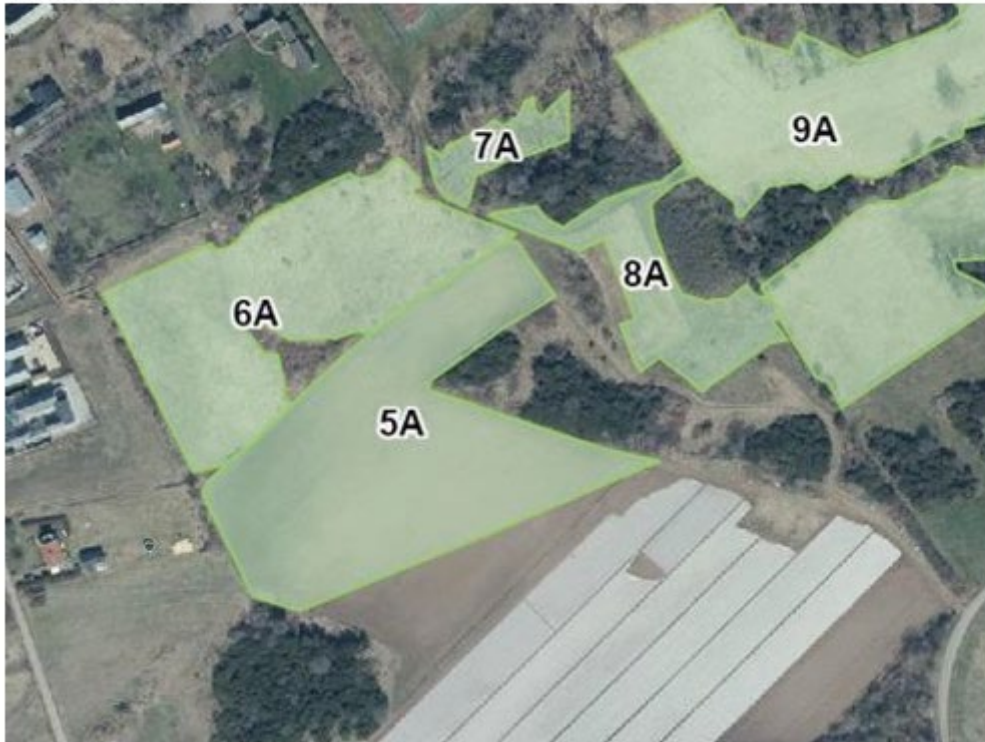
Bild 3. Positionen vid provgrävning på den aktuella åkermarken samt markprofilen till ca 40 cm djup. Jordarten är grusig och kräver bevattning för att det ska var ekonomiskt lönsamt för odling.

Bild 2. Åkermarken inom det aktuella byggområdet är skifte 5A, vilken har legat i träda, till skillnad från det större området söder om skifte 5A som är täckt med vit plast på fotot.