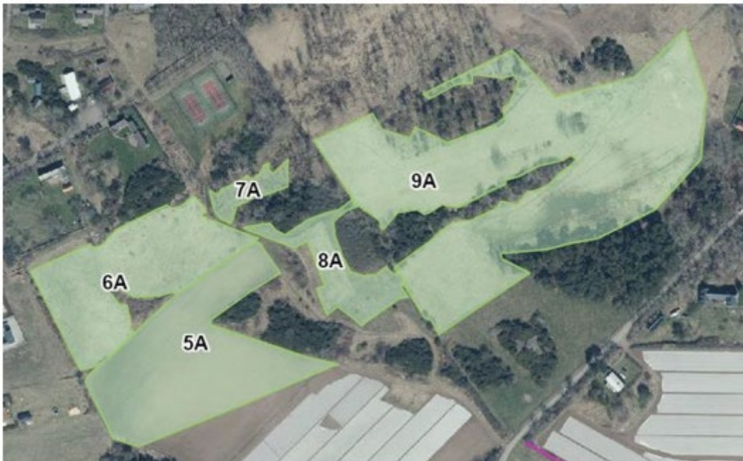
Bild 4. Betesmarken inom området är skifte 6A, 7A, 8A och 9A.

Betesmarken var stängslad samt delvis putsad vid fältbesiktningen 2024-09-06. Den nuvarande brukaren söker gårdsstöd och miljöstöd på betesmarken. Miljöstödet för betesmarken går ut 2027-12-31 enligt Jordbruksverket. Betesmarken putsas årligen, vilket betyder att det inte sker någon livsmedelsproduktion på betesmarken.